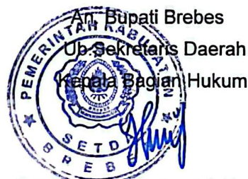
Purwaningsih Setyani S.H., M.H.

Demikian relaas panggilan ini dibuat dengan mengingat sumpah jabatan;